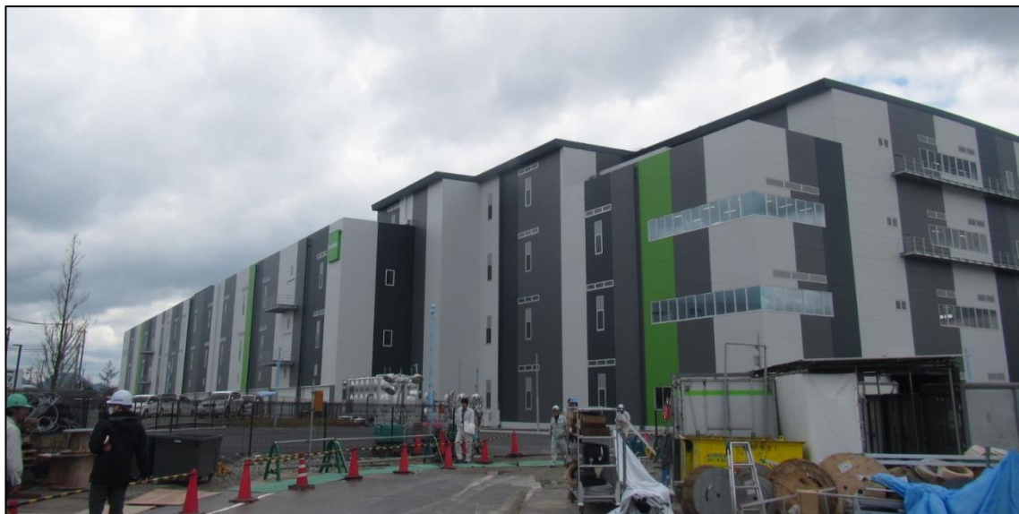
千葉県某物流倉庫