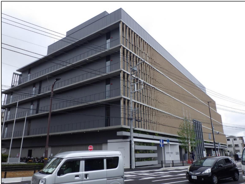
市川市第2庁舎 新築設備工事